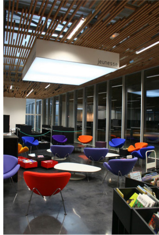
© Dealzua+/Atelier 9.81. Pubblicata il 09 Febbraio 2012.