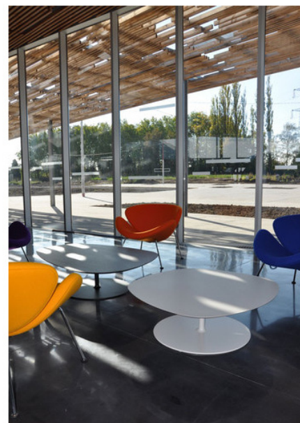
Pubblicata il 09 Febbraio 2012.