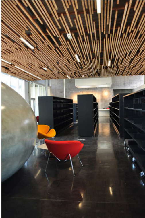
© Dealzua+/Atelier 9.81. Pubblicata il 09 Febbraio 2012.