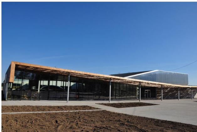
Pubblicata il 09 Febbraio 2012.

Le attività che si svolgono nel giardino s'iscrivono nella continuità culturale della mediateca che propone laboratori e percorsi pedagogici incentrati sul tema dello Sviluppo Sostenibile. Proponiamo un'infrastruttura in cui ciascuno possa sentirsi a suo agio, un'infrastruttura che permetta agli abitanti di esprimersi attraverso i laboratori, lo spazio espositivo e l'auditorium. Il progetto pone così l'accento in modo chiaro sulla dimensione partecipativa. Creare le condizioni del dialogo, realizzare un dispositivo che permetta agli abitanti di appropriarsi dell'infrastruttura: questa è la posta in gioco più rilevante del progetto.