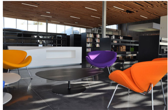
© Dealzua+/Atelier 9.81. Pubblicata il 09 Febbraio 2012.

La mediateca riproduce simbolicamente e plasticamente la propria collocazione nel punto d'intersezione tra il centro e il nord della città attraverso un atrio, adibito a esposizioni, che l'attraversa per tutta la sua lunghezza, e un doppio ingresso, l'uno a nord, l'altro a sud. La pianta è disposta in maniera naturale in direzione di un piazzale, con il quale intreccia uno stretto dialogo, inserendosi in tal modo in una pianificazione paesaggistica costituita da un sistema a fasce. Una pensilina che riproduce un gioco di luci e ombre solidifica uno spazio di transizione tra interno ed esterno. Questa infrastruttura s'inserisce nel quadro di un approccio ambientalista ispirato a una concezione bioclimatica. L'edificio è aperto in maniera naturale verso sud, mentre a nord la facciata è caratterizzata da una forte inerzia termica. La realizzazione di una facciata in legno conferisce all'edificio un carattere unitario. Le qualità di tale involucro si adattano sia alle orientazioni che al programma (filtro, facciata piena, pensilina che accompagna una facciata continua ecc.). I locali di servizi svolgono un ruolo di tampone termico a nord, mentre gli spazi di consultazione godono della luce di un patio e di un'ampia facciata con vetrata continua a sud, protetta da una grande pensilina. Recupero dell'acqua piovana, ventilazione meccanica controllata a doppio flusso, produzione geotermica nonché produzione di acqua calda sanitaria solare completano il dispositivo.