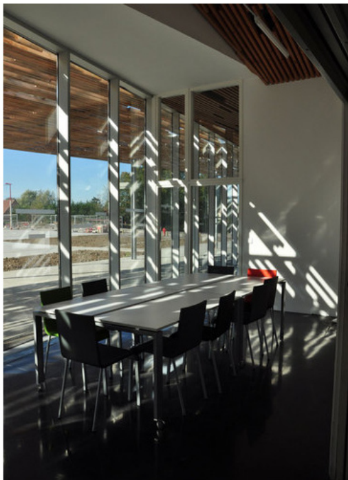
© Dealzua+/Atelier 9.81. Pubblicata il 09 Febbraio 2012.