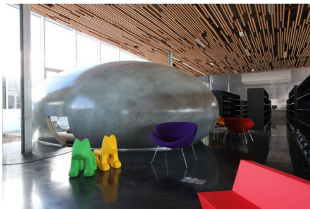
© Dealzua+/Atelier 9.81. Pubblicata il 09 Febbraio 2012.